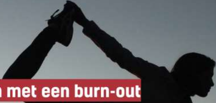
Yoga The Sunset Women Gran Canaria Silhouette